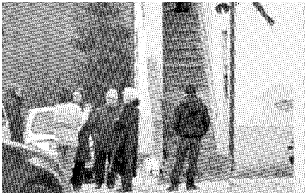
I familiari davanti alla casa della vittima e il cane con cui il veterinario cercava tartufi