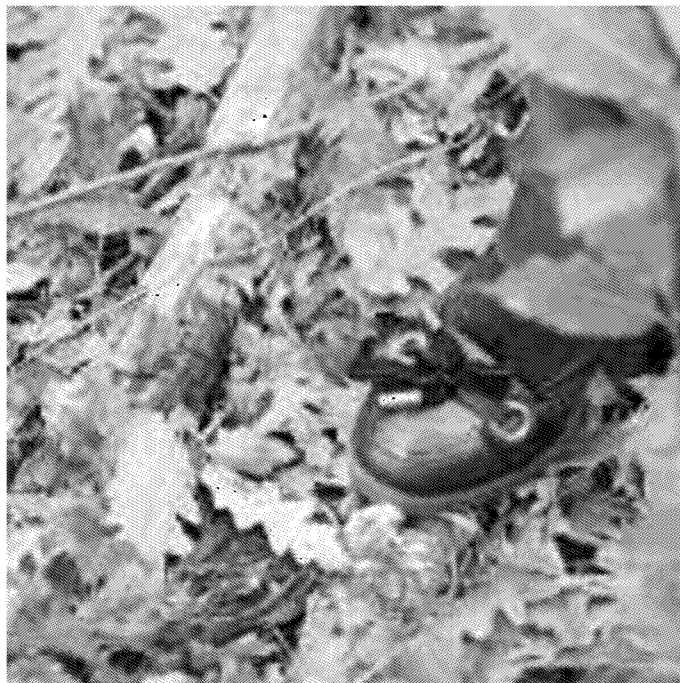
La strada che porta al luogo della tragedia